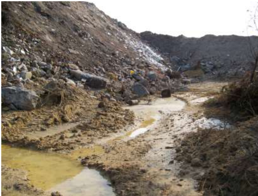
Abb. 2: Baustoff-Verkipfung in der Kiesgrube Ottendorf-Okrilla. Das eindringende Sickerwasser löst Nähr- und Schadstoffe, die wegen der fehlenden Sperrschicht ungehindert in die Kiesschichten und ins Grundwasser eindringen und dadurch auch die Moore schädigen.