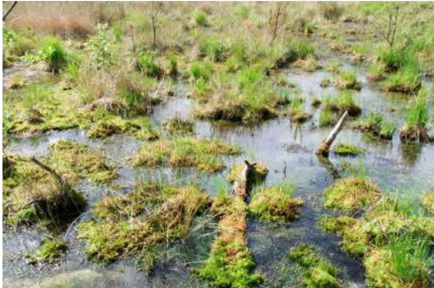
Abb. 4: Wachsendes Zwischenmoor im NSG „Moorwald am Pechfluss bei Medingen“ mit Moorschlenken, Pfeifengrasbülte, Torfmoosen und Rundblättrigem Sonnentau. Moorwachstum bedarf einer hohen Wassersättigung mit nährstoffarmen Wässern.

- des Verzichtes auf die Verfüllung der ausgekiesten Grube mit Bauschutt, so dass keine weitere Stoffbelastung des Grundwassers in der Radeburg-Laußnitzer Heide eintritt.